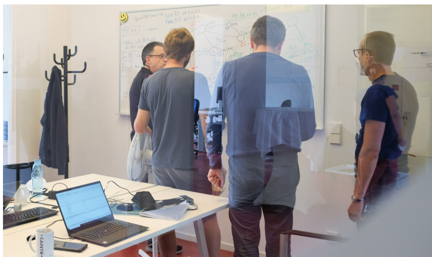
Unsere alltägliche Arbeit orientiert sich an höchsten Qualitätsstandards.

Denn schon im Beta-Stadium gefiel uns das Konzept von Projektron BCS: Das System legt nicht wie ein Krake seine Arme auf je-