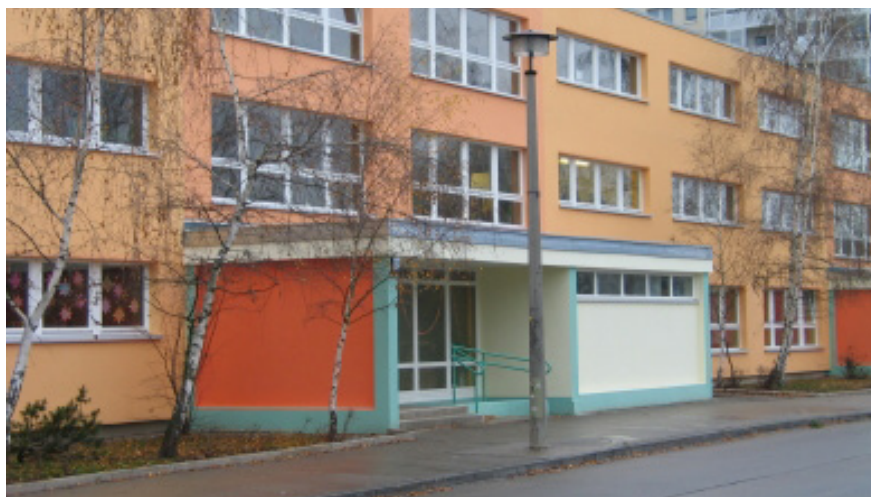
Außenansicht des Berliner Standortes

Die B.&S.U. mbH hat darüber hinaus auch Angebote für Unternehmen entwickelt, zum Beispiel die „Energy Trophy“, ein europaweiter Energieeinspar-Wettbewerb in Bürogebäuden. Die Durchführung des Wettbewerbs wird durch die Europäische Union über das Programm „Intelligent Energy Europe (IEE)“ finanziell gefördert. Mit dem European Energy Award® hat die B.&S.U. mbH gemeinsam mit Partnern aus der Schweiz und Österreich ein Zertifizierungsverfahren für kommunale Energiepolitik entwickelt, das von fast 100 Städten und Gemeinden in Deutschland angewandt wird. Ziel des europäischen Zertifizierungs- und Qualitätsmanagementsystems European Energy Award® ist es, systematisch die bisherigen energierelevanten Arbeiten in den Kommunen zu erfassen und zu bewerten, weitere Aktivitäten zu planen und einen kontinuierlichen Controllingprozess zur Energieeffizienz in der Stadt zu etablieren sowie das Know-