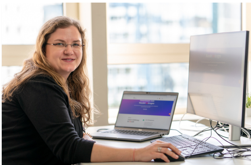
Interne Mitarbeiter nutzen BCS für die Zeiterfassung und das Abwesenheitsmanagement.

System aufgesetzt, für einige wenige Projekte konfiguriert und verfügbar. Nach einem kurzen Training für die ausgewählten Anwender ging es los.